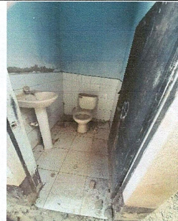
Foto 4: REPARACIÓN, MANTENIMIENTO Y MEJORAMIENTO DE SERVICIOS SANITARIOS.

Observación: Si es necesario se pueden agregar hojas adicionales y actualizar el número de hojas.