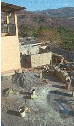
Foto 1: MEJORAMIENTO INSTALACIÓN DE ESTRUCTURA PORTANTE METÁLICA (TIPO PORTICO) Y CUBIERTA DE TECHO CON LÁMINA TROQUELADA CALIBRE 26 PARA COCINA.